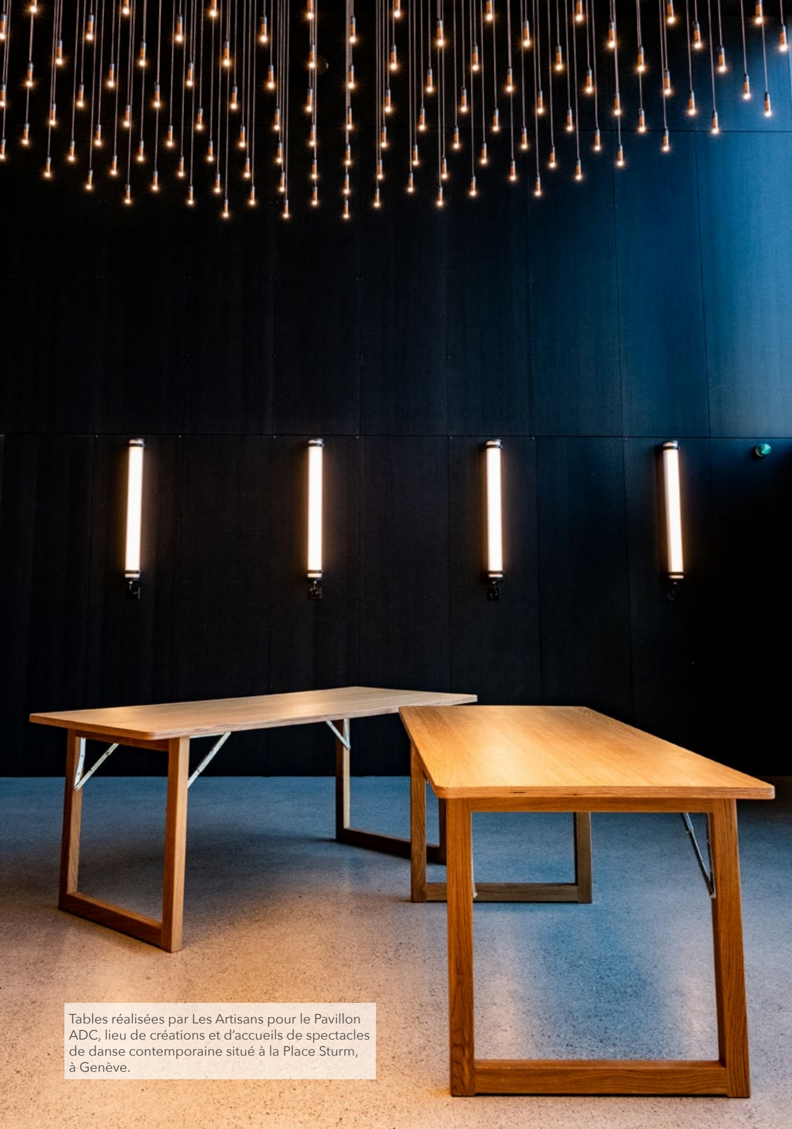
Tables réalisées par Les Artisans pour le Pavillon ADC, lieu de créations et d'accueils de spectacles de danse contemporaine situé à la Place Sturm, à Genève.