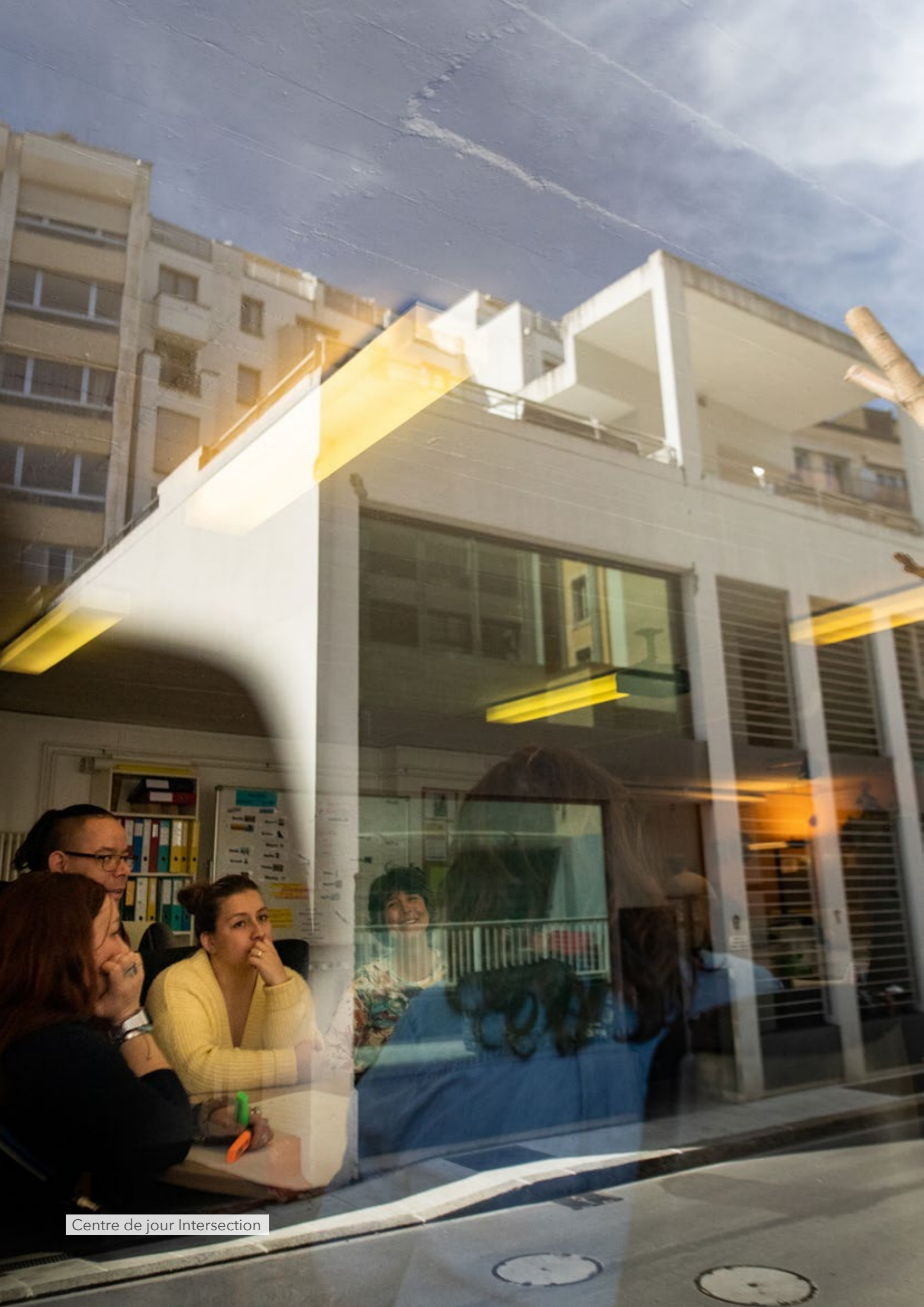
Centre de jour Intersection