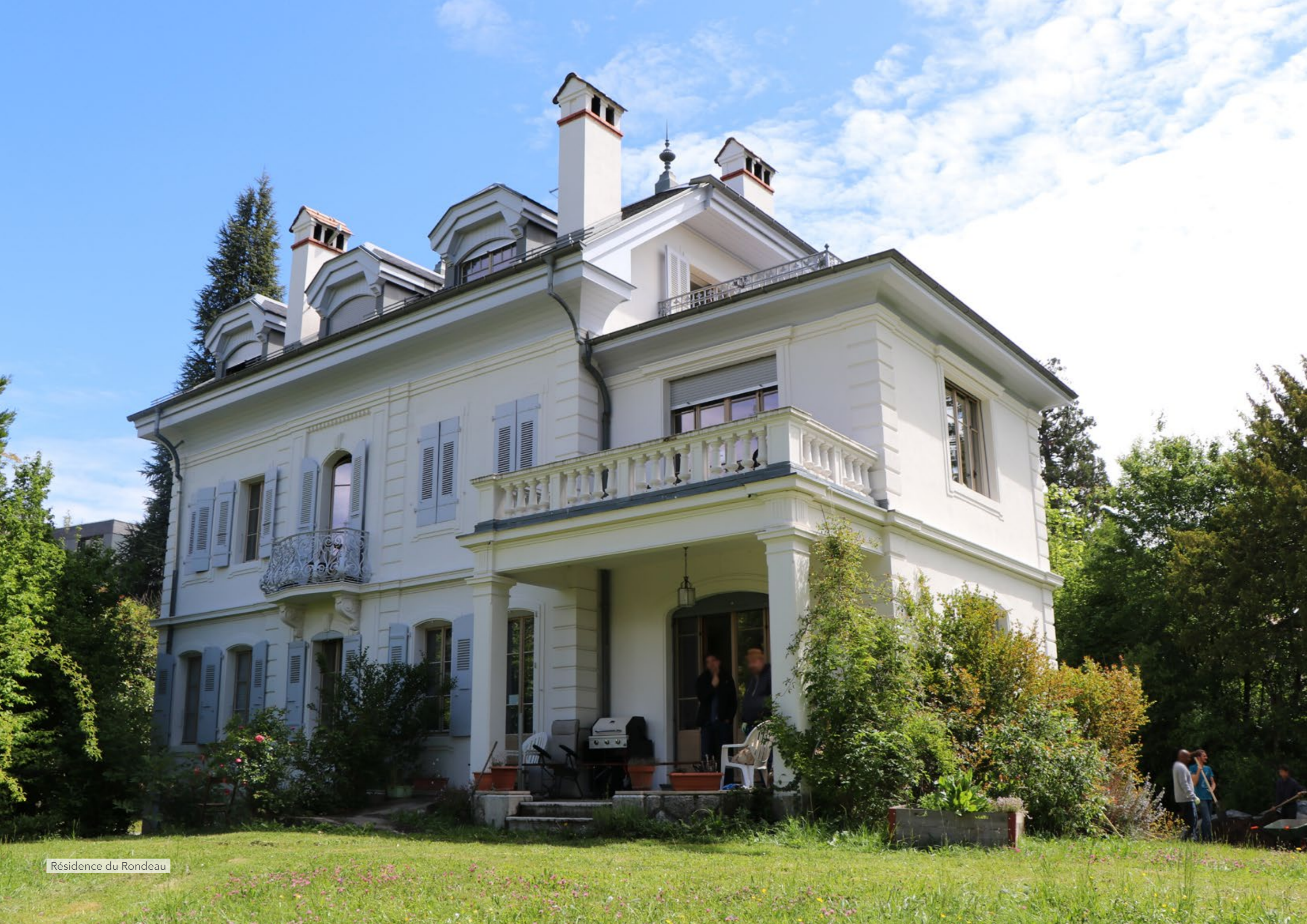
Résidence du Rondeau